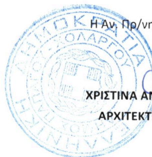
ΧΡΙΣΤΙΝΑ ΑΝΑΓΝΩΣΤΟΠΟΥΛΟΥ ΑΡΧΙΤΕΚΤΩΝ ΜΗΧΑΝΙΚΟΣ