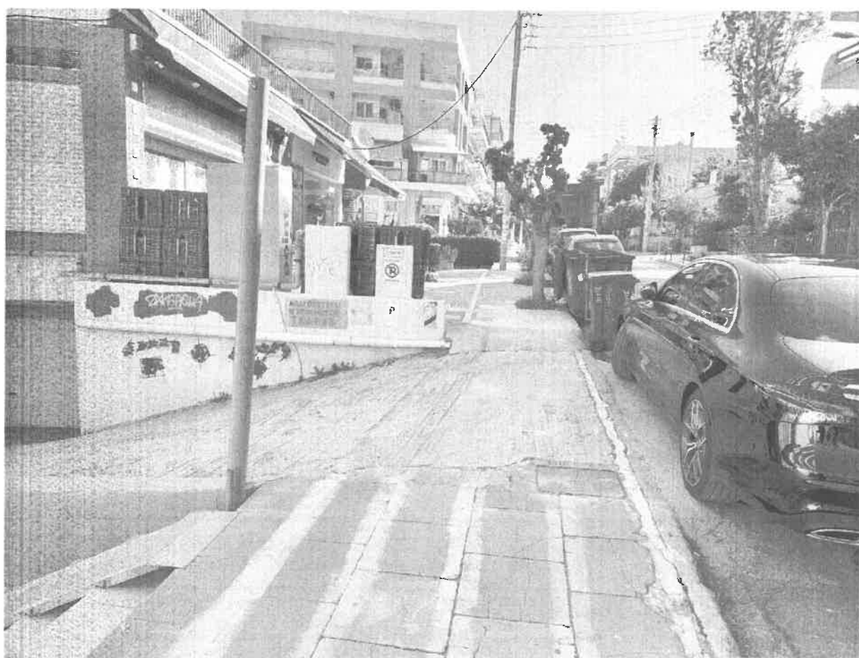
Είσοδος/έξοδος υπόγειου χώρου στάθμευσης