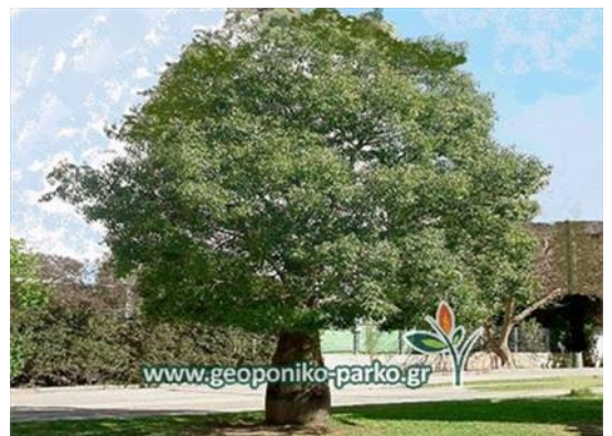
Βραχυχίτωνας σε ελεύθερη ανάπτυξη σε πάρκο

Έχουμε επισημάνει αρκετές φορές ότι η ανάπτυξη των βραχυχιτώνων είναι καταστροφική για τα πεζοδρόμια. Μετατρέπουν τα πεζοδρόμια σε μη βαδίσιμα και καταστρέφουν την όποια επέμβαση ανάπλασης είχε προηγηθεί. Η δε φύτευσή τους, στο κέντρο ενός πεζοδρομίου, ανεξάρτητα αν το πλάτος του πεζοδρομίου το επιτρέπει ή όχι, είναι άναρχη, τυχαία και εκτός προδιαγραφών. Οι βραχυχίτωνες είναι δέντρα πάρκων που στο κατάλληλο περιβάλλον μπορούν να αναπτυχθούν όπως τους αναλογεί.