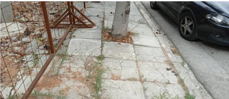
Τα δέντρα επί της οδού Εθνικής Αμύνης και η καταστροφή των κορμών που προκαλούν στο κατάστρωμα του πεζοδρομίου

Το πλάτος του πεζοδρομίου εκτός του κρασπέδου είναι 2,30μ. Η φύτευση των δέντρων είναι στο κέντρο με αποτέλεσμα η βαδισιμότητα του πεζοδρόμιου να είναι αδύνατη, ειδικά για αναπηρικό αμαξίδιο.