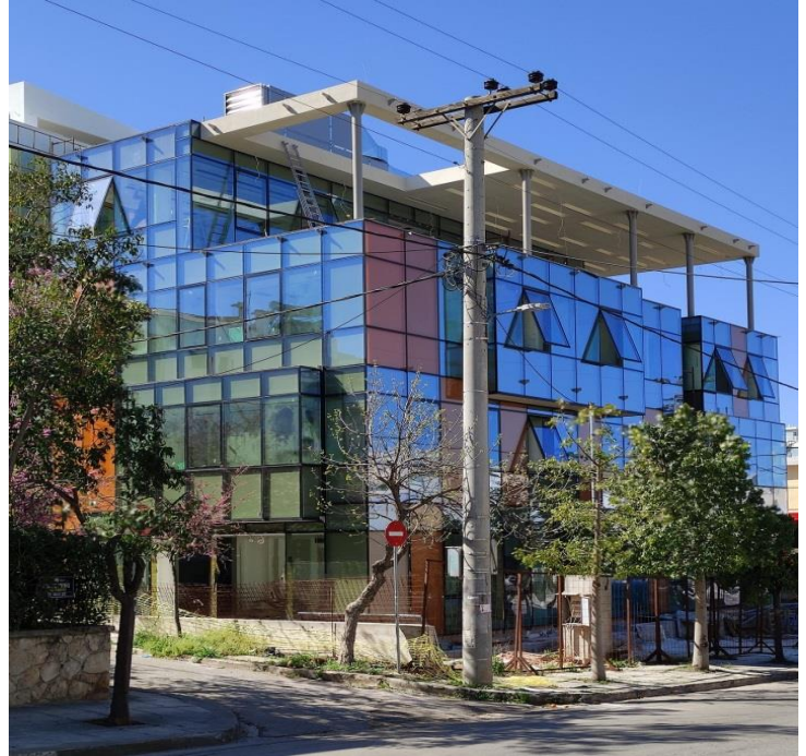
Οι φυτεμένες κουτσουπιές στο διπλανό οικοδομικό τετράγωνο επί της οδού Εθνικής Αμύνης και επί την οδού Αυλώνος

Οι κουτσουπιές έχουν τα εξής χαρακτηριστικά χαμηλό ύψος, είναι φυλλοβόλες με αποτέλεσμα να αφήνουν τις ακτίνες του ήλιου κατά τους χειμερινούς μήνες να εισέρχονται στο πεζοδρόμιο, προσφέρουν υπέροχο χρώμα κατά τους ανοιξιάτικους μήνες και δεν προκαλούν ουδεμία βλάβη στο κατάστρωμα του πεζοδρομίου, ούτε ανασήκωση ούτε ρηγμάτωση. Θεωρούμε ότι όταν είναι φυτεμένες στην σωστή θέση αφήνοντας ελεύθερο το προβλεπόμενο κατά τον νόμο πλάτος πεζοδρομίου, τότε είναι μία καλή λύση για την φύτευση των πεζοδρομίων, όπως ακριβώς και οι νεραντζιές.