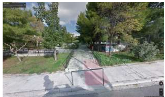
Είσοδος Πλατείας Φλωρίνης, υφιστάμενη κατάσταση

Η πλατεία βρίσκεται σε αναπτυσσόμενη περιοχή της κοινότητας Παπάγου, όπου παρατηρείται εγκατάσταση νέων νοικοκυριών και οικογενειών. Ωστόσο η επισκεψιμότητά της είναι περιορισμένη, καθώς οι περίοικοι προτιμούν να κατευθύνονται σε ανάλογους χώρους (π.χ. Μεγάλο Πάρκο Παπάγου) όπου λειτουργούν πιο σύγχρονοι και πιο φιλικοί στα παιδιά κοινόχρηστοι χώροι με συνέπεια πολλές φορές τον κορεσμό των συγκεκριμένων σημείων.