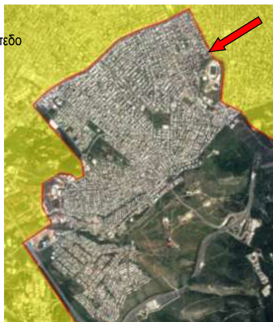
Εικόνα 2. Αεροφωτογραφία της ευρύτερης του Δήμου Παπάγου - Χολαργού. Επισημαίνεται η θέση του οικοπέδου

Το πρόσφατο Τοπογραφικό Διάγραμμα του οικοπέδου παρατίθεται προς ενημέρωση των διαγωνιζομένων ως Προσαρτήματα του παρόντος τεύχους. Το εμβαδόν του οικοπέδου με τα στοιχεία Α,Β,Γ,Δ,Ε,Ζ,Η,Α έχει έκταση 985,12 τ.μ.